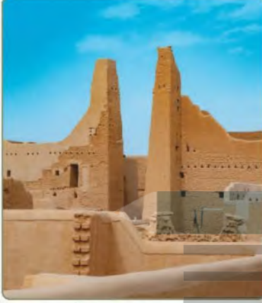
بيت المال في الطريف